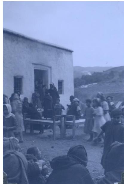
במבנה זה נמצא הקבר של סיד אהרן. עולי רגל צעירים וזקנים מסביב לשולחן שבו מוכרים את המאחיה המבורכת של הצדיק