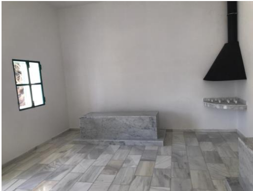
הקבר השלישי שמשמאל לכניסה - אלמוני