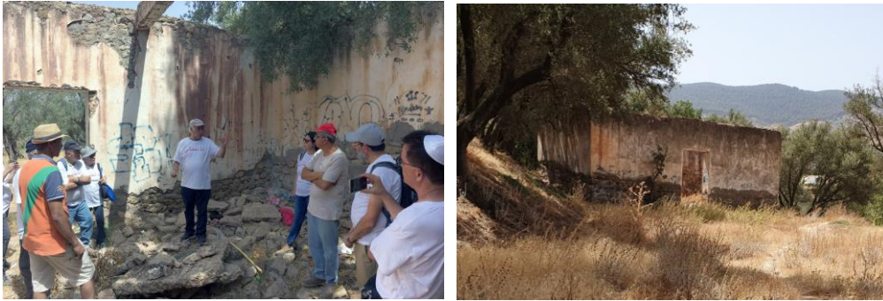
חברי משלחת התיעוד בתוך מבנה הקבר, על שברי התיקרה שקרסה (יולי 2019)

מועצת הקהילות היהודיות במרוקו, לא זכתה לברכתו בטענה שהיא "יקרה מדי". הצעת הוועד להתחיל במימוש בשלבים בהתבסס על התקציב הקיים נותרה ללא מענה מצידו של ברדוגו.