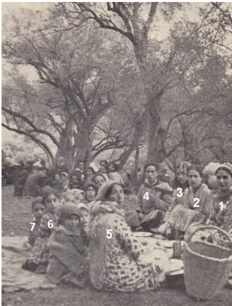
ההילולה לסידי אהרן. עולי הרגל סועדים בסביבת קבר הצדיק (1952)